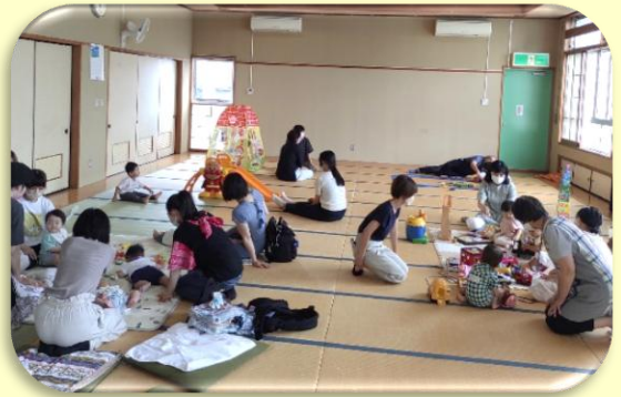
子育てサロンの様子