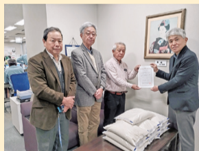
西沼目自主防災会