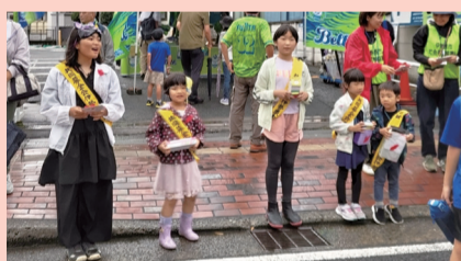
手作り募金箱で募金活動(道灌まつり)