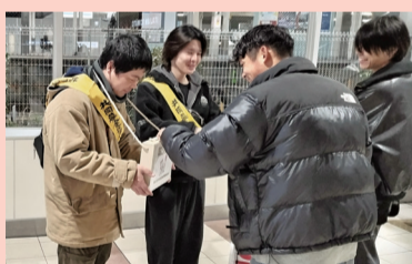
市光工業(株)労働組合