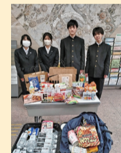
伊志田高等学校生徒会

令和6年度実績(累計) 寄託金 42件 1,880,508円 寄託品 30件 (お菓子、米、備蓄用食料品、タオル等)