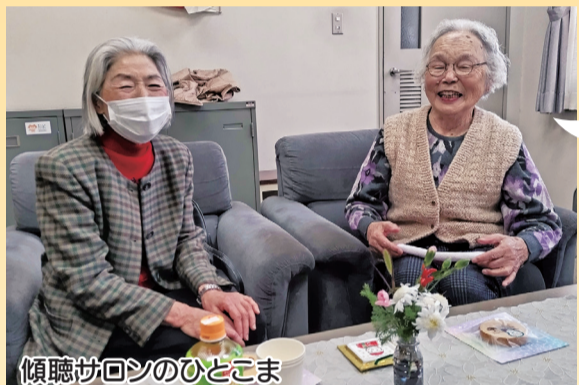
傾聴サロンのひとこま

ぴあ・こすもすは、市が開催する傾聴ボランティア養成講座を修了した会員が、施設や個人宅などを訪問し、傾聴活動をおこなっています。令和5年度からは、訪問活動だけでなく、月に1回のサロン活動をスタートしました。善意銀行では、このサロン活動に配分金の交付をおこなっています。