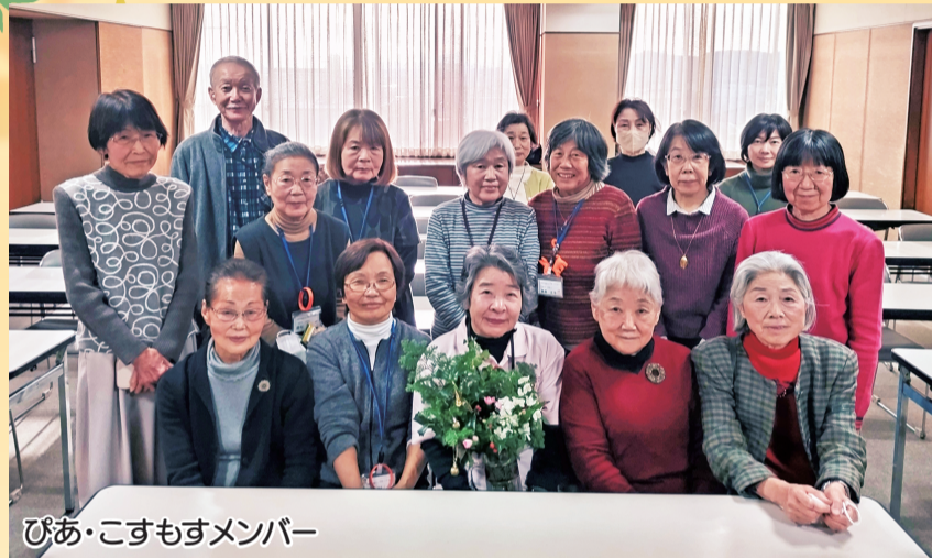
ぴあ・こすもすメンバー

※傾聴とは、相手のいうことを否定せず、耳も心も傾けて、相手の話を「聴く」会話の技術を指します。