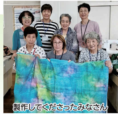
製作してくださったみなさん