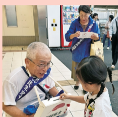
伊勢原市民生委員児童委員協議会